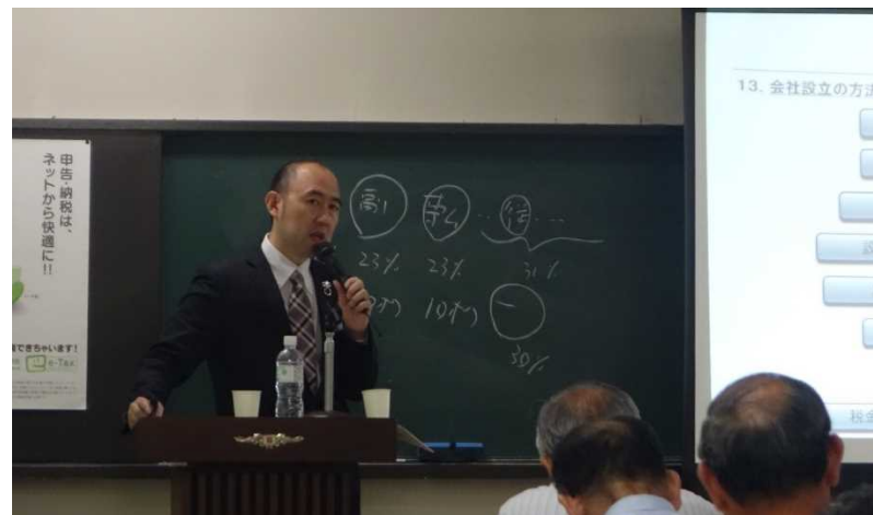
「種類株式を活用した中小企業の事業承継対策」(税理士会 荒川支部研修会主催)