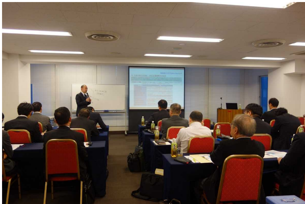
「民事信託のスキームと提案方法」(イデアルコンサルティング主催)